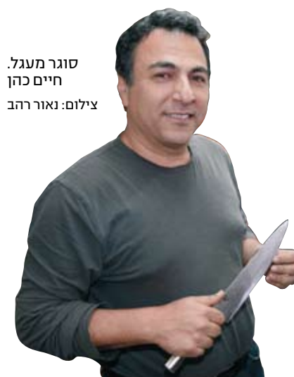
סוגר מעגל. חיים כהן

אילן שחורי הוא הוקר תולדות תל אביב. פרטים על סיורים שהוא עורך אפשר למצוא באתר: mytelaviv.co.il